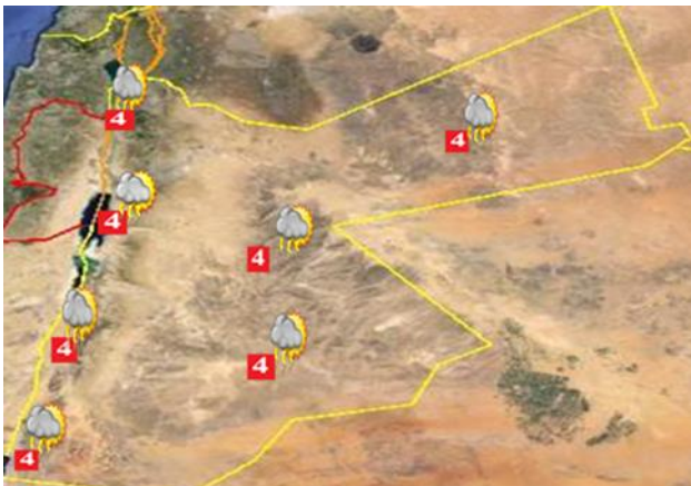
الحالة الجوية المتوقعة وخارطة التحذيرات لهذا اليوم

درجة الحرارة الصغرى الليله القادمة في العقبة ١٧°س